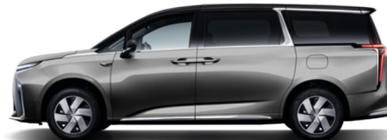
Meteorite Lime mit schwarzem Dach